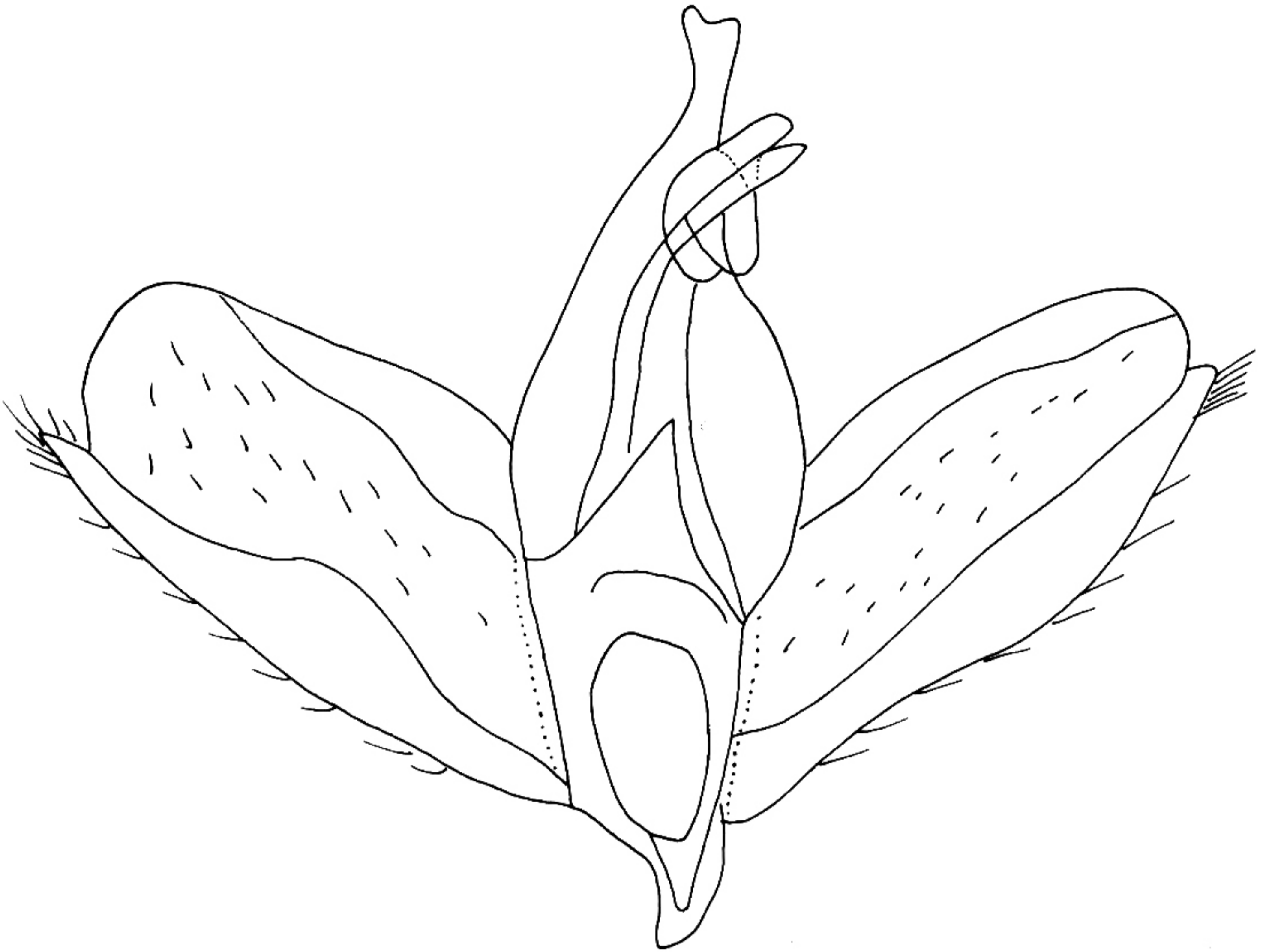
图 84 隐篦舟蛾 Besaia ( Besaia ) inconspicua (Wileman) 的雄性外生殖器 (仿 Schintlmeister, 1992)

翅展 40 mm。前翅浅褐色，中纵纹暗色，终止于外线；内线、外线和端线均由黑点组成；从顶角伸到外线的斜纹不太明显。后翅灰白色。